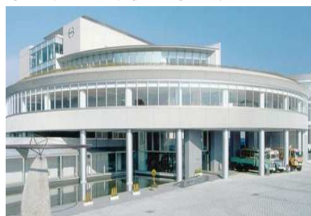
▲日野自動車21世紀センター