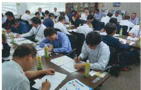
▲10分間PDCAサイクル実施中