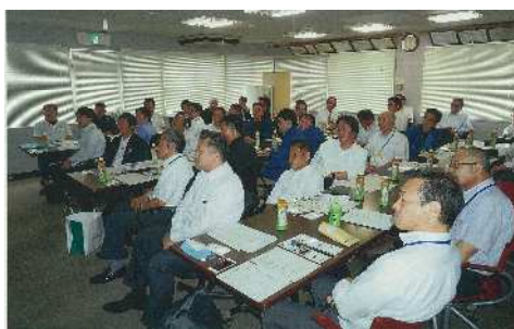
▲講話受講中の管理者の方々