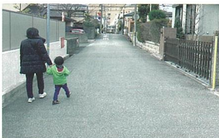
子供を見かけたら、大人と一緒にでも油断しないこと

KYT(危険予知訓練)は、交通場面を見て、どこに、どういう危険があるかを想像することで、危険を予測する訓練法です。