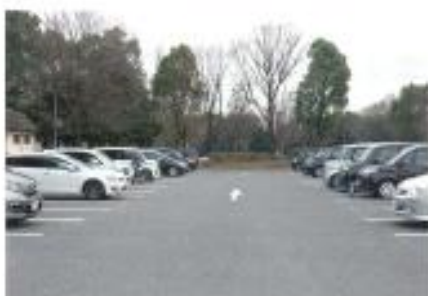
混雑している駐車場では、万遍なく注意を払おう

KYT (危険予知訓練) は、交通場面を見て、どこに、どういう危険があるかを想像することで、危険を予測する訓練法です。