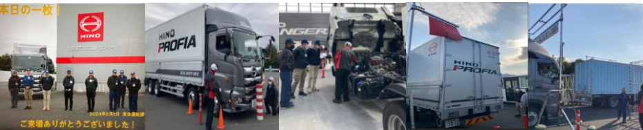
参加集合写真 死角確認 燃料切れ対応 特設走行(後退時)・(高さ制限)