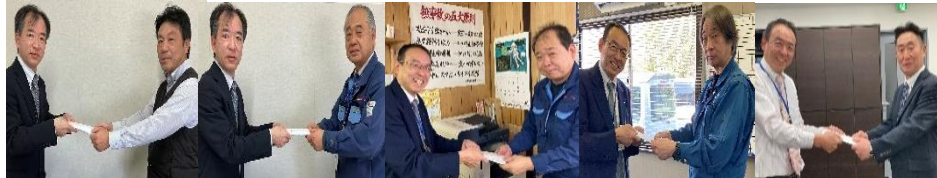
(丸一ロジテック(株)古河)(千代田運輸(株)古河)(東西配送(株)日野)(街ワールドキャリー(代表、千代田運輸(株))

◆陸送会社第1位 ◆陸送会社第2位 ◆陸送会社第3位 ◆陸送会社アップ賞 ◆貨物積載個人賞