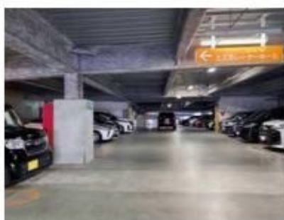
駐車場内では、歩行者と駐車車両の動きに気をつけよう

KYT (危険予知訓練) は、交通場面を見て、どこに、どういう危険があるかを想像することで、危険を予測する訓練法です。